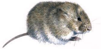
De Noordse woelmuis ( Microtus oeconomus ) is een zeldzame woelmuis die in de ijstijd van Scandinavië naar ons kustgebied trok. Op Texel is hij algemeen en niet beperkt tot natte gebieden.

Andere natuurresevaten zijn Wassenaar en 't Visje, die langs de Waddendijk ten noorden van De Cocksdorp liggen. Wassenaar is in de trektijd een